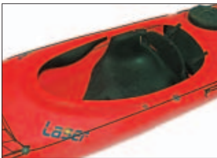
Bardzo wygodne siedzisko w Laserze.