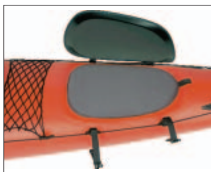
Neoprenowy dekiel i polietylenowa pokrywa komory bagażowej Kodiaka.

W Kodiaku zastosowano neoprenowe dekle przykrywane następnie polietylenowymi kła-