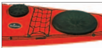
Gumowe dekle komór bagażowych w Laserze.

pami dociskaniymi do luków regulowanymi paskami. Szczelność i skuteczność tego rozwiązania nie budzi naszych zastrzeżeń, luki są większe, co ułatwia pakowanie, paski służące mogą do mocowania zapasowego wiosła. Minusem takiego rozwiązania jest utrudnione założenie neoprenowego dekla na wodzie przy pomocy kajakarza pływającego obok nas (np. gdy potrzebujemy dostać się do komory bagażowej w trakcie płynięcia).