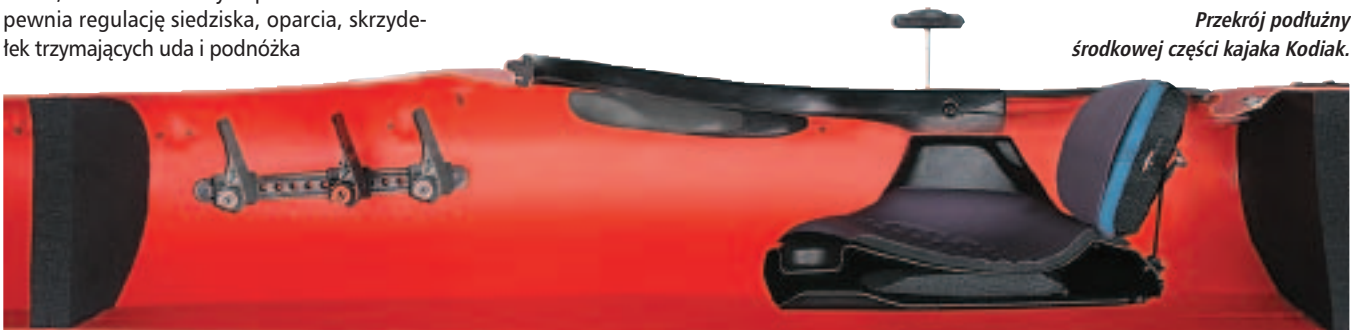
Przekrój podłużny środkowej części kajaka Kodiak.

Oba kajaki są bardzo stabilne. Ze względu na odmienny profil dna inaczej pracują na bocznej fali (w tym zakresie odsyłamy do literatury dotyczącej kajakarstwa morskiego).