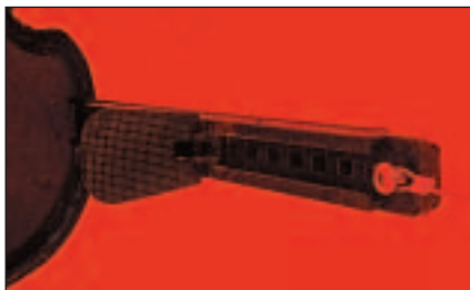
Ciekawe rozwiązanie mocowania linek sterowych do szyn i bardzo prosta regulacja podnóżka w Laserze.

o tym Kacper płynąc w grudniu na Narwi przy temperaturze w okolicach 0°C. Skrzydełka trzymające uda są stałym elementem kokpitu, ich kształt jest optymalny, niezależnie od wzrostu, wagi i budowy kajakarza. Największe zastrzeżenia w kajaku Rainbow budzi oparcie, które jest z twarde – po wielu godzinach wiosłowania czuje się wbijającą się w plecy taśmę mocującą, co powoduje dyskomfort. Ponadto jego skuteczna regulacja wymaga w praktyce opuszczenia kajaka lub pomocy kolegi. Opar-